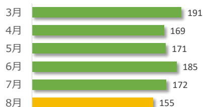
相談件数の推移（直近 6 か月）

遺族等の求めに応じて相談内容をセンターが医療機関へ伝達したものは 4 件でした。（累計 57 件）